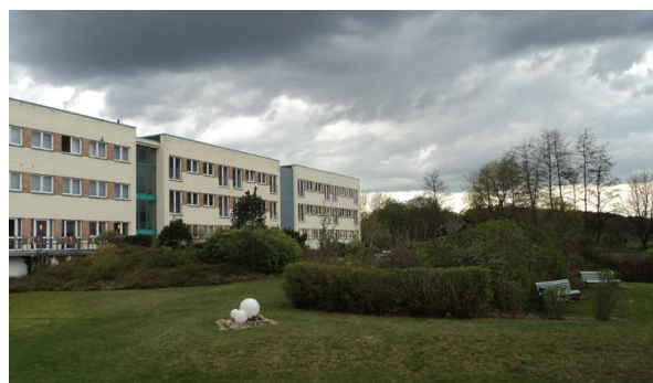
Trend Hotel i Banzkow

Rigtig godt hotel beliggende i stor have. Store og lyse værelser, alle med bad/toilet og TV, mange med flotte udsigter. God restaurant med dejlig mad, udeservering og bar. Der er sauna-område i kælderen, hvor der også er et lille interessant lokalhistorisk museum, som vi besøger.